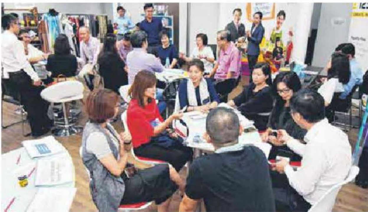
零售业的突破。 业者参加大师班，集思广益寻求业务上的突破。

她形容，零售管理学院的大师班除了是给本地中小企业带来新概念，也是一个交流平台，让各商家可以互相学习及合作。